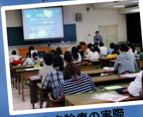
不育症診療の実際

募集定員 15名程度 ※応募者多数の場合は選考。 募集期間 2013年11月18日(月)～2014年1月17日(金) 募集要項 ホームページ、教務グループ担当(下記) より入手可能