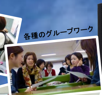
各種のグループワーク

募集定員 15名程度 ※応募者多数の場合は選考。 募集期間 2013年11月18日(月)～2014年1月17日(金) 募集要項 ホームページ、教務グループ担当(下記) より入手可能