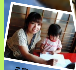
子育て広場で学ぶ