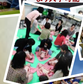
ベビー マッサージ