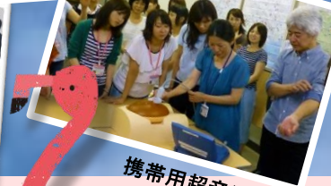
携帯用超音波装置