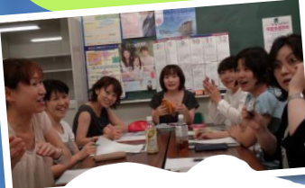
各種の グループワーク