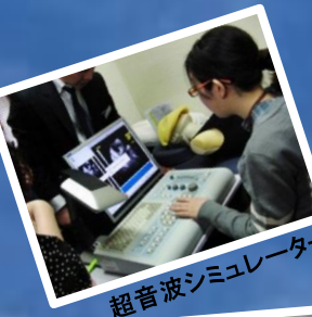
超音波シミュレーター