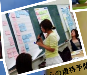
妊娠中からの虐待予防