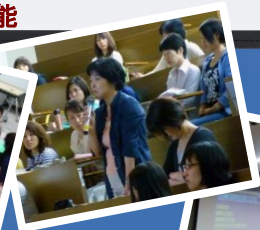
生命倫理 セミナー